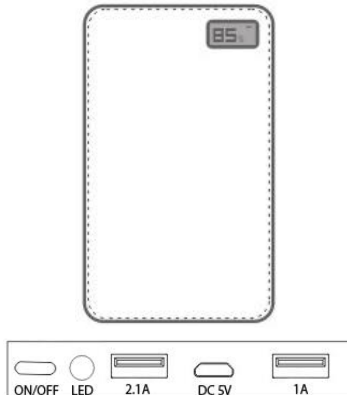
Diagramme du T138